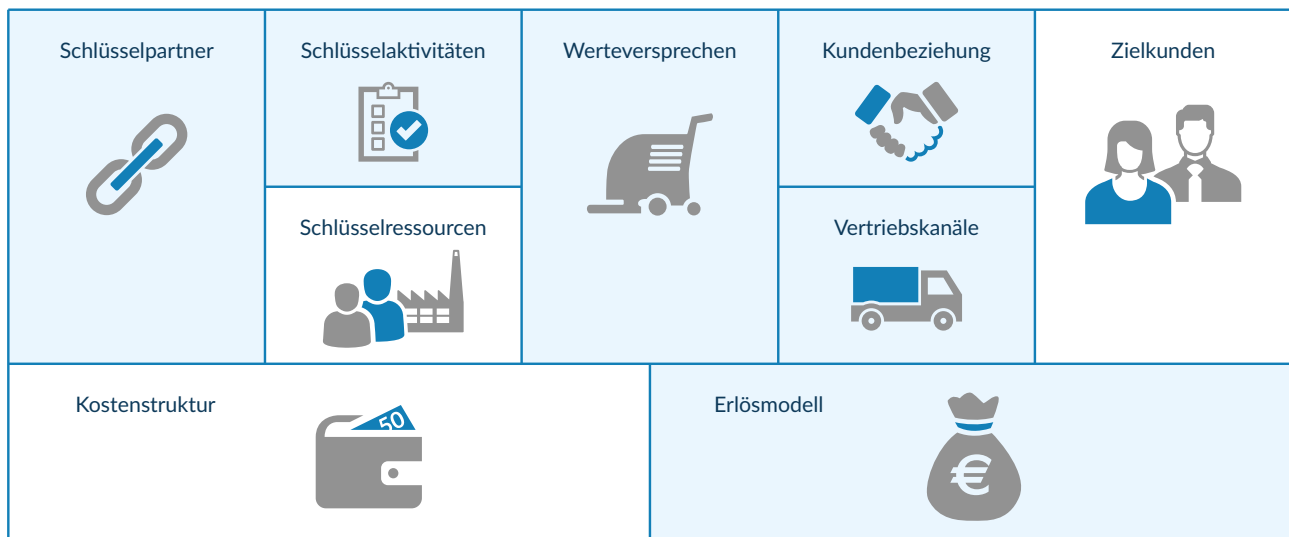
Abbildung 1: Eigene Darstellung Business Model Canvas nach Osterwalder et al. (2010)

Durch die Vernetzung der Reinigungsmaschinen mit IoT Technologien ergibt sich die Möglichkeit für den Produzenten, Reinigung als Dienstleistung anzubieten. Die blau eingefärbten Bereiche in Abbildung 1 sind jene Geschäftsmodellkomponenten, die sich durch die Digitalisierung des Produktes und seiner Services verändert haben.